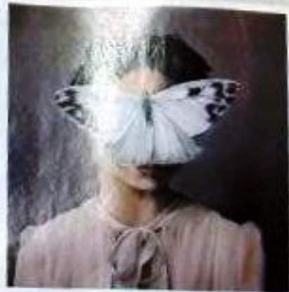
“כטיוול במדברת”, כפי שהיא סימלה לי. אם תרצו - זה חופש כלכלי.

כיום היא מטיחה פחות כאתר שלה, ויותר ביועץ אישי לעצמאים שרצים ללמוד לסיכוי את עצמם אינסטרנטית. “אני עושה את זה מיל החשבון, בבית, עם כרטיס קפה. זה אחת לשבוע או שבועיים. בשעות פנויות או גולגולין. זה חופש המון זמן ואני מרוויחה כזה יפה מאוד”. אבל דרוו לא מסתפקת בזה. לפני שנה ננתה ציטה ליר הכנתה, על טעם שרכשה, “יש מי שמנהלים אותו עם עבודה, והו עוזר כפי שנוכח. רכשנו גם חקיקת ברוכי הארץ, אנחנו בעצם לוקחים חלק מהכספים לעצמנו, וחלק מטיקים בעד הסקטור מניבות”.